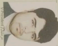
مړسند / President گل احمد Gul Ahmad

شرکت ساختمانی، سړک سازی و لوژستیکي اتصال مصور sar Mosawer Construction, Road Building and Logistic Comp.